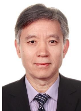
陈维江 院士 国家电网公司