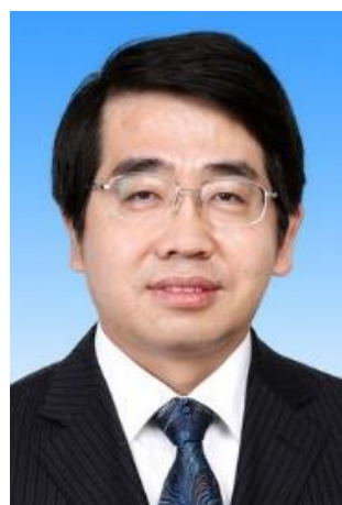
黄维 院士 西北工业大学