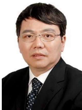
丁汉 院士 华中科技大学